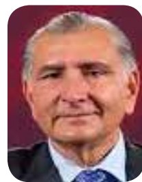
Adán Augusto López

La exigencia del PAN de auditar el aumento de más de 11 mil por ciento en la partida presupuestal que maneja Adán Augusto López vuelve a colocar en el centro del debate un tema tan sensible como recurrente en la política mexicana: el uso discrecional de los recursos públicos. Más allá del choque partidista, las cifras por sí solas generan sospecha en una sociedad cansada de explicaciones técnicas que pocas veces se traducen en claridad real. Adán Augusto sostiene que el incremento obedece a una reclasificación contable ordenada por el Consejo Nacional de Armonización Contable, y aunque el argumento puede ser jurídicamente válido, políticamente resulta insuficiente si no va acompañado de una rendición de cuentas exhaustiva y verificable. Cuando una partida pasa de poco más de ocho millones a casi 900 millones de pesos, el deber de explicar con detalle no es una concesión a la oposición, sino una obligación frente a la ciudadanía. Las acusaciones del PAN sobre posible control político o uso electoral de la llamada "caja chica" pueden sonar exageradas, pero encuentran terreno fértil en la opacidad histórica del Poder Legislativo. En un contexto donde Morena presume una nueva ética pública, este caso representa una prueba clave: transparentar a fondo el gasto, abrirlo al escrutinio y disipar dudas.