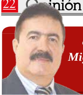
Columna de Miguel Ángel Vega C.